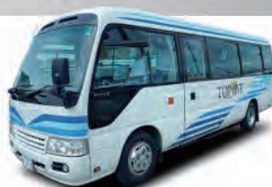
23+6人乗りバス [リエッセII A/T]