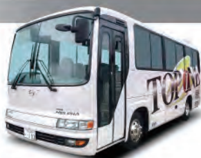
26+2人乗りバス [メルファ7 M/T]