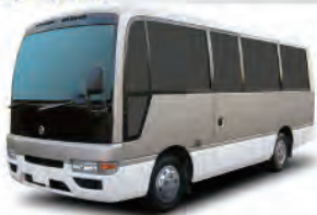
21+8人乗りバス [シビリアン A/T]