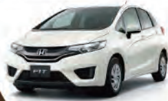
コンパクト ハイブリッド車 乗用