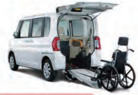
軽四 スローパー [福祉車両]