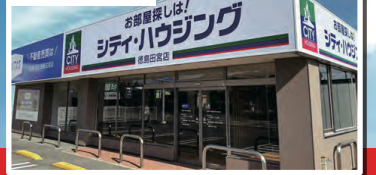
シティ・ハウジング公式サイト