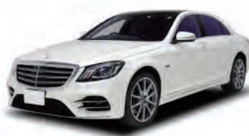
メルセデスベンツ [Sクラス]