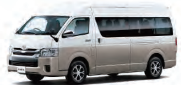
ハイエース グランドキャビン [10人乗り]