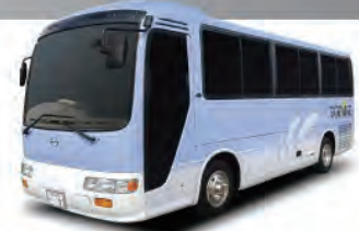
23+6人乗りバス [リエッセ M/T]