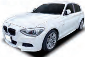
BMW [116i M Sport]