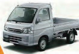
軽四貨物 バン [A/T] 軽四トラック [4WD A/T]