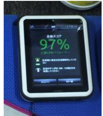
前回開催時の光景